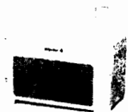
PARLANTES MASTER-G SPB30W