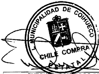
EXEQUIEL GALLEGOS SEPULVEDA ENCARGADO ADQUISICIONES CHILECOMPRA