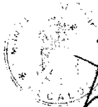
ARNOLDO JIMENEZ VENEGAS Alcalde de Coihueco